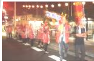
真田一門も踊りの輪に