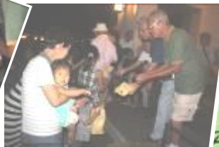
わたしも、踊ったよ…