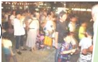
多くの子ども達の参加