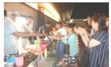
たこせんのトッピング リクエストにお応えします！