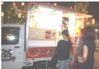
たこ焼きに長くのびた行列