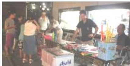
飲み物も、たくさん買って いただきました。