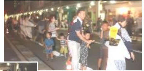
多くの人達が参加！